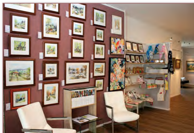
Foto: Interiér Galerie malířů Beskyd, kde je mimo jiné vystaven zmiňovaný obraz Ferdiše Duši Lázně Skalka.