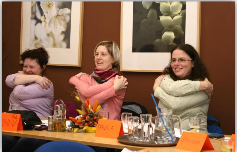
Nahoře: Na kurzu jógy prstů se účastníci mimo jiné dozvěděli, že gesta rukou a prstů ve vztahu k ostatním částem těla (mudry) jsou univerzální ve všech kulturách a používají se tisíce let. Dole: Práce se skupinou je důležitým prvkem arteterapie.

Současně s rekonstrukcí budovy se proto uskutečňuje v prostorách rehabilitačního centra další vzdělávání zaměstnanců ve skupinkách pro 6 až 12 účastníků. Vzdělávací programy jsou zaměřeny na výuku speciálních aktivit pro seniory s cílem