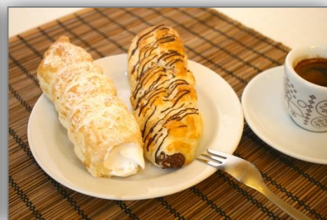
Foto: Velkou oblibu si také získaly čerstvé domácí zákusky. Zleva doprava: zákusek „bílý sen“, klasický větrník a trubičky - s bílkovým sněhem nebo s čokoládovou šlehačkou.