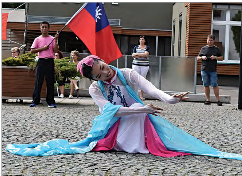
Nahoře: Ukázku Tai-či zahájila tanečnice dřepem na jedné noze. Uprostřed: Tanec s lucernami, který se tančí v Den luceren, předvedla mladá děvčata. Dole: Palácový tanec se vyznačuje nádherně barevnými kostýmy, další fotografie z tohoto tance je na titulní straně.