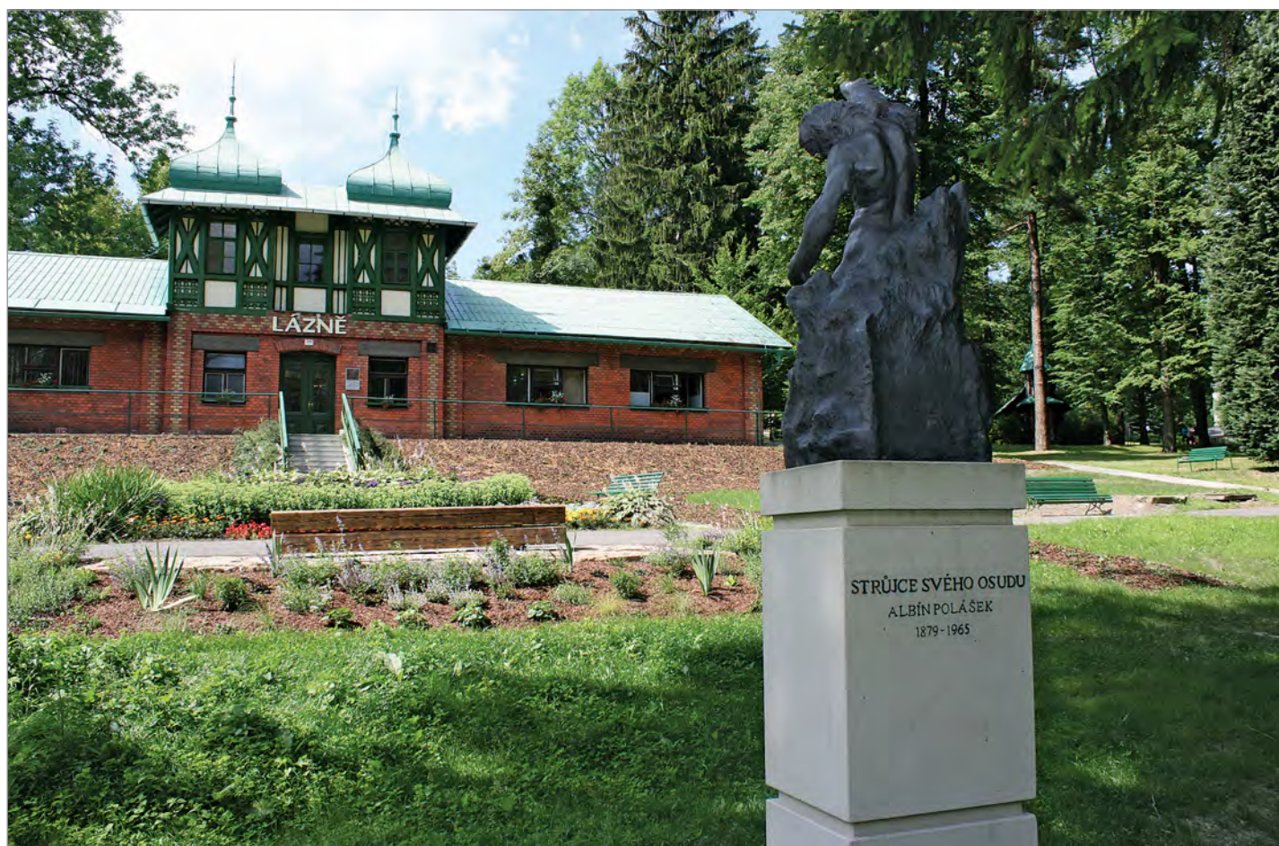
Kopie sochy Strůjce svého osudu (původně z roku 1907) od Albína Poláška je umístěna nedaleko od budovy Lázní (1899) v parku BRC.

bylo hledat cestu, jak ostatním zprostředkovat emoce, inspirované pohybem a krásou. Téma vlastního sebe-utváření pak zpracovával celý svůj život.