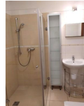
Fotografie jsou ilustrační