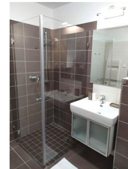
Fotografie jsou ilustrační