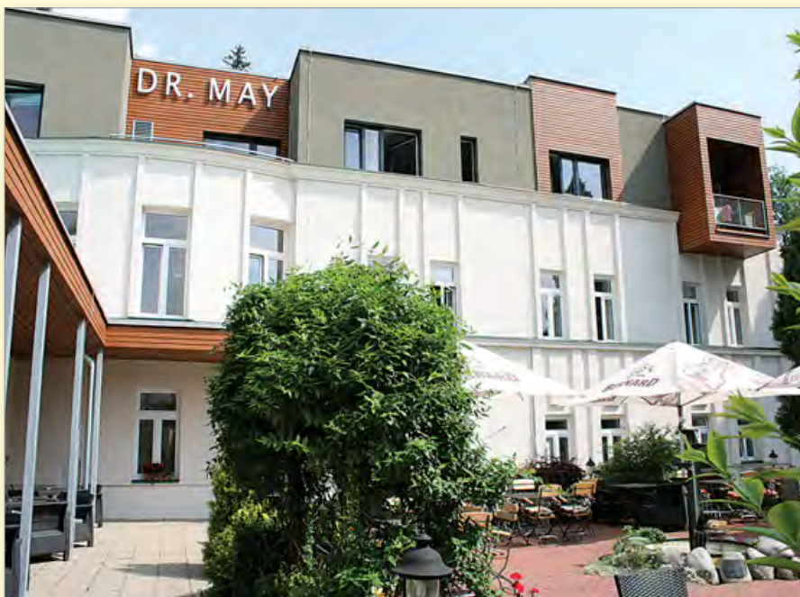
Foto: Léčebný dům dr. Maye prošel celkovou rekonstrukcí v roce 2016. V jeho přízemí jsou umístěna pracoviště fyzioterapie a ergoterapie, elektroléčba, vodoléčba, oxygenoterapie a další procedury. V dalším poschodí je ordinace lékaře, ošetřovna a jídelna. Dvoulůžkové pokoje s vlastním sociálním zařízením a s televizí jsou vybavené polohovacími lůžky a jsou bezbariérové.

4) Bolí vás žlučník, trpíte různými alergiemi, nebo máte lupénku či astma? Pak budou pro vás vhodnější lázně.