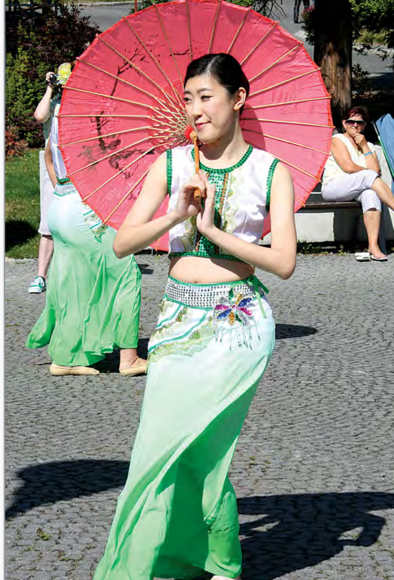
Dole: Folklórní tanec s názvem Jí, při kterém tanečnice používají speciální krabičky, do kterých si neprovdané dívky uschovávaly svá tajemství. Tyto krabičky se používají stejně jako kastaněty.

Ladnost pohybů tanečnic přiložené fotografie sice částečně přibližují, úžasný byl ale především soulad jejich pohybů a tanečních figur s hudbou. Už při prvním tanci diváci snad ani nedýchali. A já jsem úplně zapoměla, jak nezvykle mi předtím zněla hudba samotná – k těm tancům prostě patřila. K mimořádnému zážitku přispěly i kostýmy – unikátní a na každý tanec zcela odlišné. Mně osobně se nejvíce líbil tanec TÁJ s deštníky. (Na fotografii vpravo.)