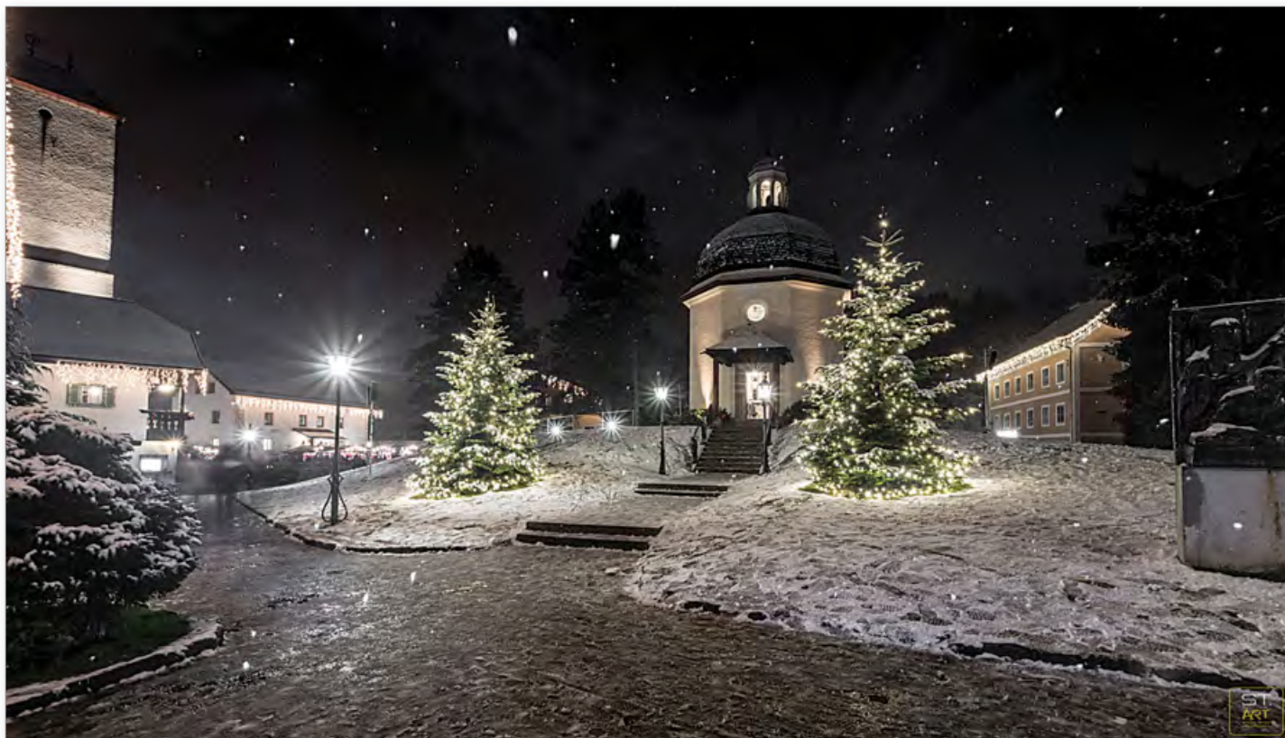
Foto: Kaple, která je na místě původního kostela, kde vznikla vánoční píseň Tichá noc, tuto událost připomíná. Článek „ Tichá noc byla původně Píseň nebes “ byl publikován 13. 12. 2013 na: neviditelnypes.lidovky.cz .