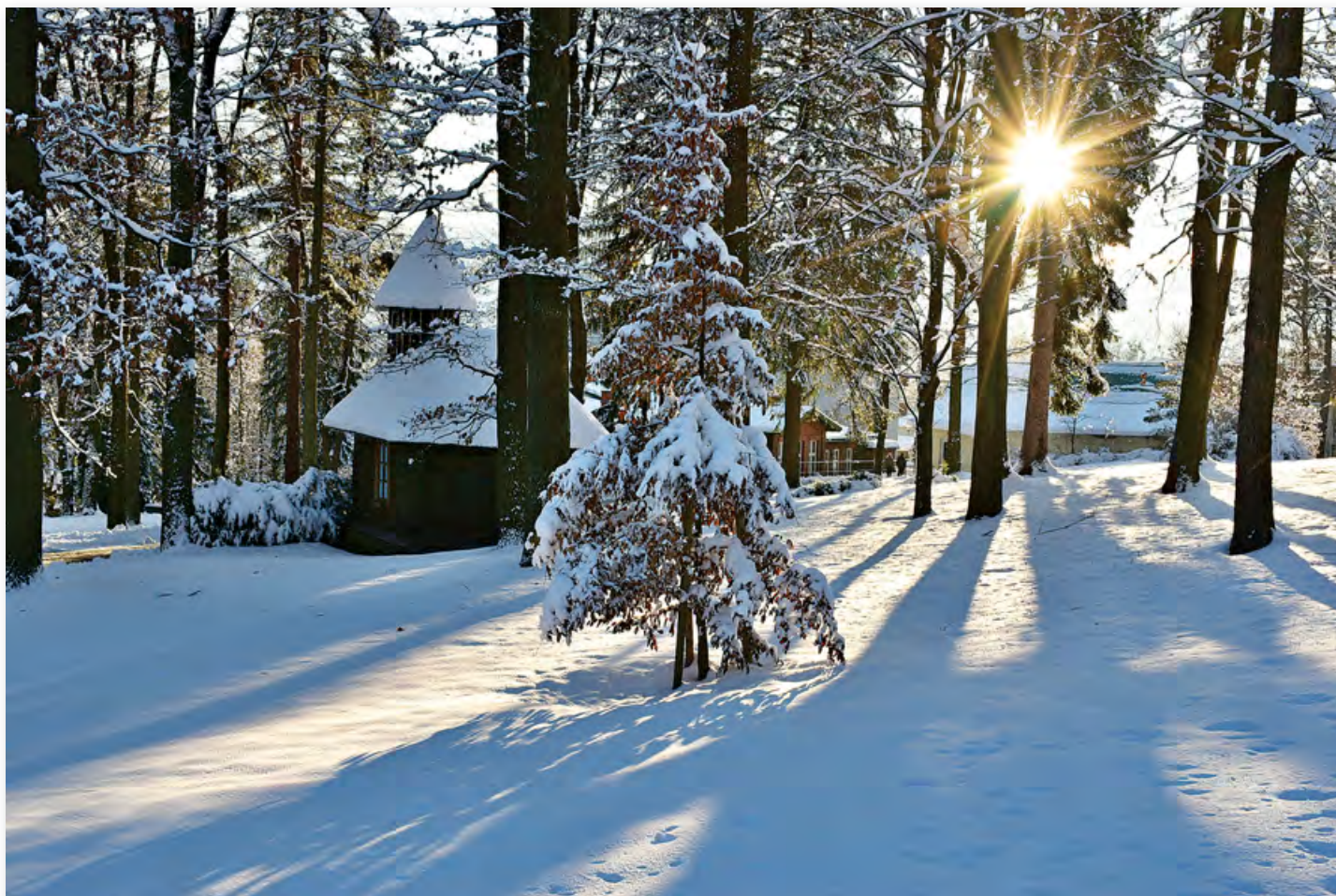
Foto: Milena Vaculová: Poděkování (kaple Nejsvětější Panny Marie v parku BRC Čeladná)

Časopis ČELADENSKÁ FONTÁNA je vydáván pro zaměstnance, klienty a partnery Beskydského rehabilitačního centra v Čeladné. Cílem Fontány je přinášet informace všem, kteří se chtějí dozvědět více o tom, jak zde, na úpatí Ondřejníku, pomáháme těm, kteří potřebují upevnit zdraví. Je to jednoduché: díky zdejším mimořádně příznivým klimatickým podmínkám a vysoké úrovni rehabilitační péče je BRC vyhledávaným zdravotnickým zařízením s výbornou pověstí. Za neopakovatelnou a dnes velmi vzácnou atmosférou rodinných lázní k nám jezdí pacienti z celé republiky. Tímto zveme i vás. Všechna vydání Čeladenské fontány najdete také na www.brc.cz .